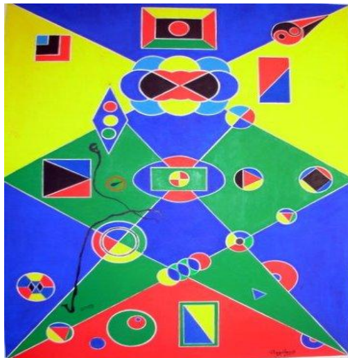
PINTURA CÓSMICA: CREAR VIDA.